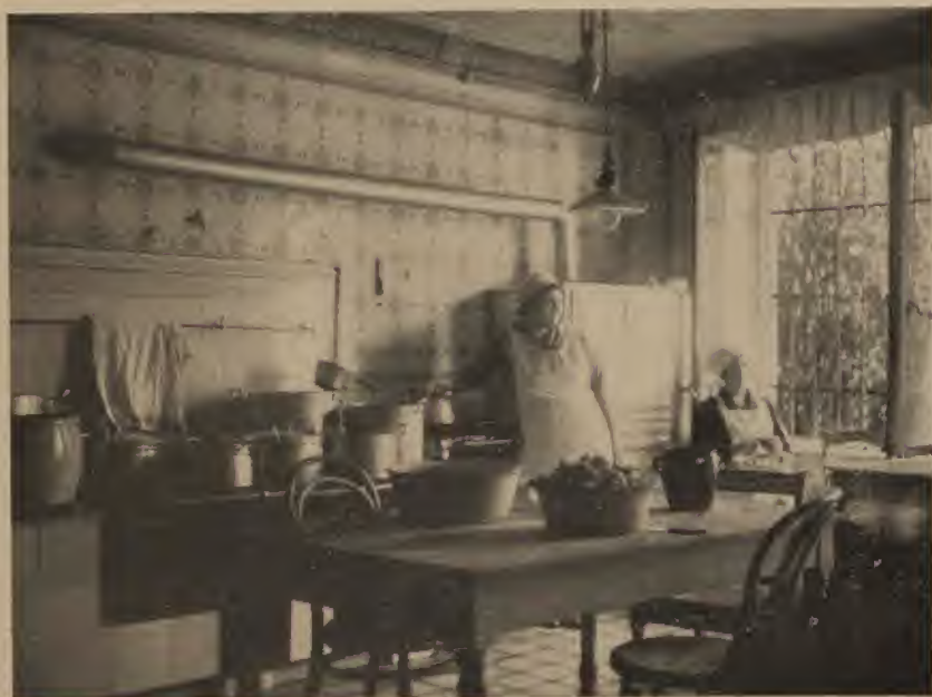
Küche im Heim für jüdische Mädchen und Frauen e. V.